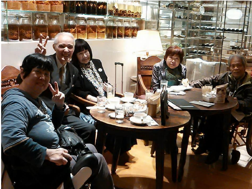
↑ 「公開討論会」出席のあとの食事会にて。

スなど、CILの基本的な活動の他、活動資金作りのため「自立生活海外旅行」を企画して、アメリカ、カナダ、オーストラリアなど、福祉先進国に多くの仲間たちを同行し、刺激を与えてくれました。