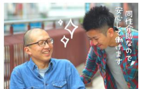
※撮影の為、マスクを外しております。