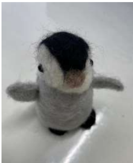
くりはら あきこ つうしょう せいさく 栗原亜紀子さん(通称クリリン)制作の にんぎょう フェルト人形