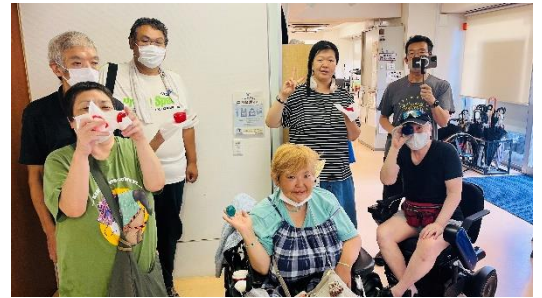
新マスターを中心に！↑

まずは恒例の自己紹介タイム。参加者は、呼ばれたい名前やどこから来たか、そして「New & Goods」をシェアしました。